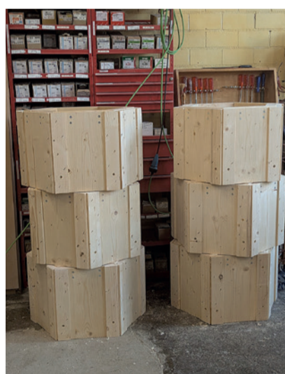
Neben den grossen Elementen werden auch kleinere Module gefertigt.